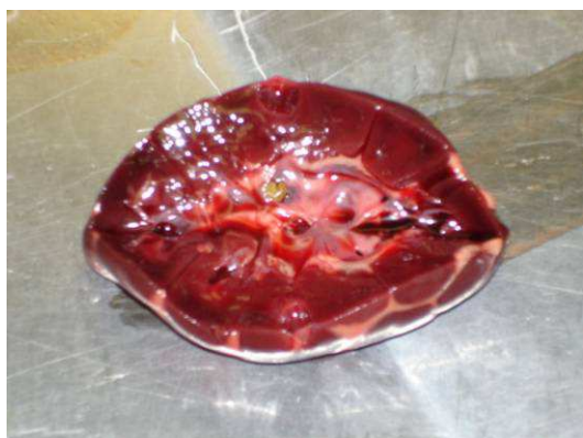
Lithiase rénale

Les loutres présentent souvent des lithiases rénales, bien que l'impact sur leur santé soit faible. La découverte de calculs rénaux lors d'une autopsie ne doit donc pas être automatiquement corrélée à une quelconque cause de dépérissement ou de décès, sauf en cas de lésions évidentes de pyélonéphrite sévère associées. Les reins des loutres sont multilobulaires et de même taille. Lors des autopsies, il faut couper les reins longitudinalement, puis en quatre pour explorer tout le parenchyme à la recherche de calculs. Les calculs rénaux sont plus fréquents chez les loutres en captivité (CAPBER 2007, WEBER et al. 2002) que chez les loutres en liberté (SIMPSON 1997), bien que sur 30 loutres autopsiées par la suite, un auteur n'ait trouvé que 2 cas (WEBER et al. 2002). Deux individus sur les 40 loutres autopsiées en Bretagne, présentaient des calculs rénaux sans conséquences apparentes (GMB 2007). Sur les 252 loutres autopsiées à l'université de Cardiff entre 2001 et 2003, 10 animaux, soit 4%, présentaient des calculs rénaux, alors que les années précédentes (1998-2000) le pourcentage était d'environ 10% et certains animaux présentaient de très gros calculs impactant la fonction rénale (CHADWICK 2007). Sur 102 loutres autopsiées au Danemark entre 1980 et 1990, 16 présentaient des calculs rénaux, soit 18,8%, ce qui constitue un pourcentage élevé comparé aux études précédemment citées (WEBER et al. 2002).