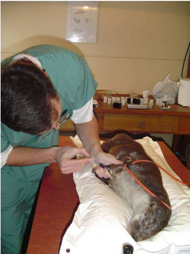
Prise de sang

Les prises de sang sont réalisées comme chez le chien ou le chat à la veine céphalique ou jugulaire. La veine cave crâniale, utilisée avec succès chez le furet, pourrait aussi théoriquement être une option intéressante sur un animal déshydraté et/ou en hypovolémie.