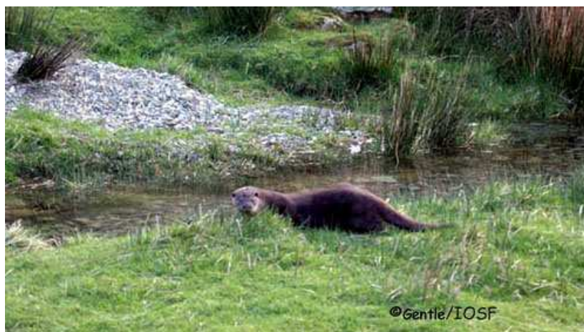
Relâché d'une loutre après une réhabilitation au centre de soins de l'IOSF en Ecosse

Le présent document a pour but d'apporter une aide aux personnes confrontées à la découverte d'une loutre sauvage en détresse et à sa prise en charge sur le court et le long terme. Après un exposé succinct sur l'espèce, le document présente la marche à suivre, les précautions à prendre et les soins à apporter, notamment dans le cas de la découverte d'un jeune visiblement séparé de sa mère. Les protocoles vétérinaires et les pathologies connues sont détaillés dans la troisième partie. Ce document s'adresse à toute personne susceptible de trouver et de récupérer une loutre en détresse, plus particulièrement au personnel de centre de soins et aux vétérinaires. S'il a été conçu avant tout dans le cadre d'une réflexion sur la prise en charge de loutres sauvages en détresse, il peut également être utile aux personnes travaillant avec des loutres captives dans des parcs de présentation au public.