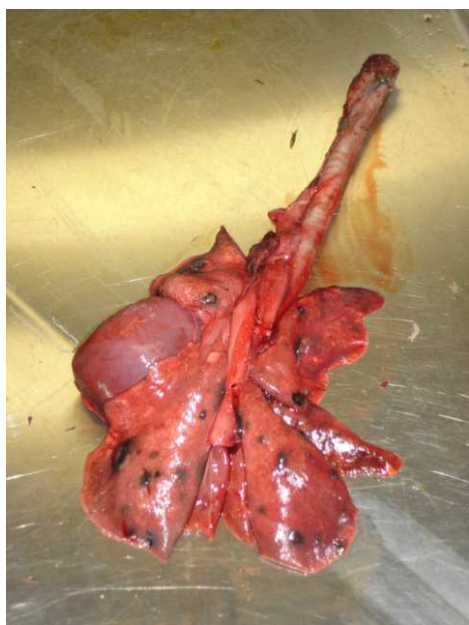
Appareil respiratoire

Les poumons des loutres sont originaux du fait de l'existence de deux lobes à gauche et quatre lobes à droite. Le lobe apical est desservi par une bronche accessoire (SIMPSON 1997). Le pelage particulièrement isolant des loutres joue un rôle primordial dans le bilan énergétique et toute perturbation de cette couche protectrice augmente les risques d'infection. Il a été par exemple observé que des loutres victimes de marées noires mourraient de pneumonie (KRUIK 2006). Les infections faisant suite à des morsures peuvent fréquemment évoluer en pleurésie, pneumonie ou pleuro-pneumonie ( cf. supra ).