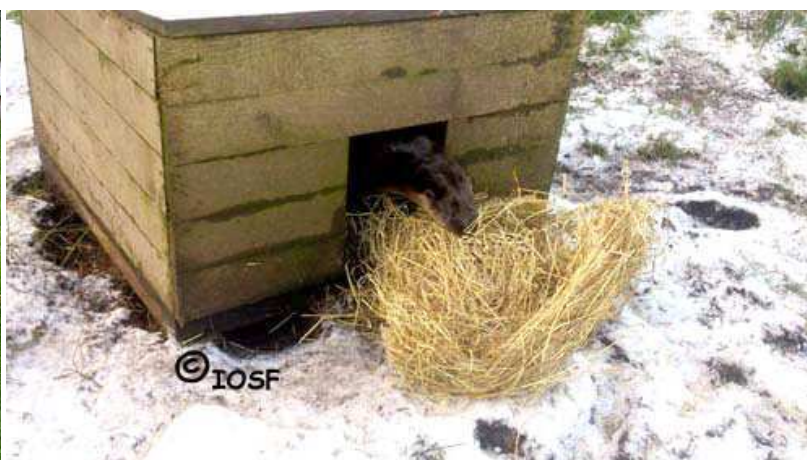
Photos prises au centre de soins (wild animal hospital) de l'IOSF en Ecosse