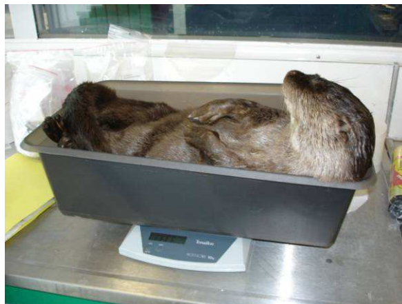
Pesée d'une loutre adulte anesthésiée