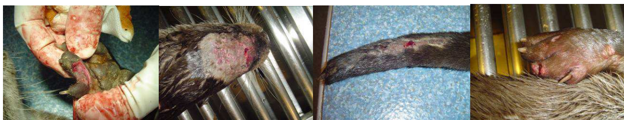
Blessures sur un doigt, le crâne et la queue, doigt amputé

Les lésions externes les plus fréquentes sont les morsures par des congénères tant en liberté qu'en captivité (SIMPSON 2006, CAPBER 2007). La tête, les extrémités des pattes et le périnée sont les sites les plus souvent mordus. Si l'agresseur est une autre loutre, l'espacement entre les impacts des crocs est compris entre 18 et 22 mm (SIMPSON 2006). Les morsures superficielles guérissent seules, les plus profondes évoluent en infection locale (à Streptococcus sp. le plus souvent), voire en septicémie ou en pleurésie (à Pasteurella sp. le plus souvent), et conduisent à la mort dans 10% des cas. La piètre condition des loutres présentant des morsures peut résulter de leur difficulté à chasser pour s'alimenter, mais aussi être à l'origine de leur vulnérabilité à des attaques par des chiens ( cf. infra ) ou des congénères. Il est nécessaire de bien examiner l'animal sous anesthésie car certaines morsures sont profondément cachées sous les poils. L'utilisation d'eau tiédie pour mouiller les poils peut faciliter la découverte de plaies difficilement visibles dans une fourrure sèche ou ensanglantée.