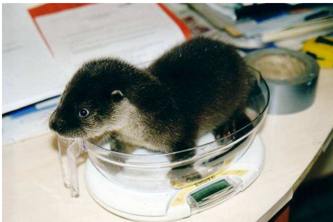
Pesée d'un loutron

Il serait souhaitable de réaliser systématiquement une parasitologie des selles, mais le plus souvent une vermifugation est la règle avec de l'oxfendazole, du fenbendazole ou de l'ivermectine aux doses employées pour les carnivores domestiques (JACQUES 2008).