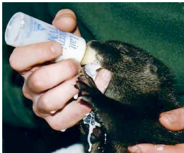
Allaitement au biberon d'un loutron

Rapidement, du lait maternisé pour carnivores doit être proposé avec une seringue de 5 puis 10 ml (JACQUES 2008), toutes les 2 ou 3 heures. Par exemple, un loutron de un mois et demi doit boire 5 biberons de 60 ml de lait maternisé TVM par jour de sorte que sa prise de poids journalière soit de 15 à 20% (GREEN 2000). La quantité représente environ 30% du poids du loutron répartie sur le nombre de repas journalier. L'orphelin doit être nourri alors qu'il repose sur son ventre et non sur son dos. Après chaque tétée, il faut masser le périnée avec un coton tiède pour stimuler miction et défécation. Pendant la période d'allaitement, des selles normales sont semi-solides, jaunâtres et parsemées de grumeaux blanchâtres.